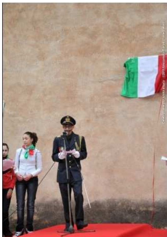
FOTO DELLA SFILATA